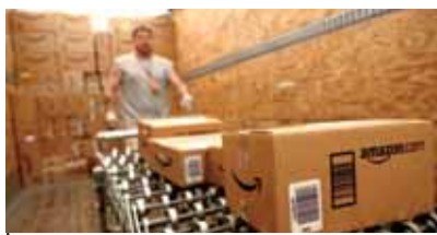
AMAZON A VERCELLI UNA SFIDA (ANCHE) SINDACALE pag. 3