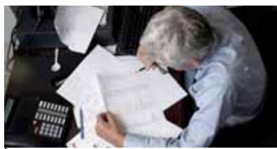
FONDI PENSIONE PERCHÈ CONVIENE ADERIRE pag. 5