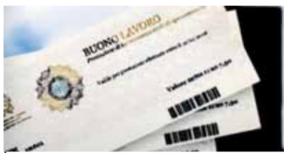
VOUCHER L'ITALIA È ORA UN PAESE MIGLIORE pag. 2